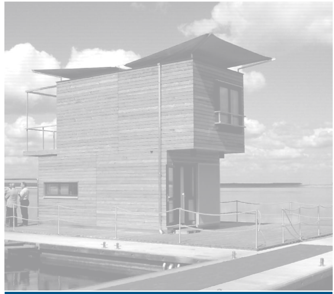
ABBILDUNGEN ZEIGEN SONDERMASSE- BZW. AUSRÜSTUNGEN.